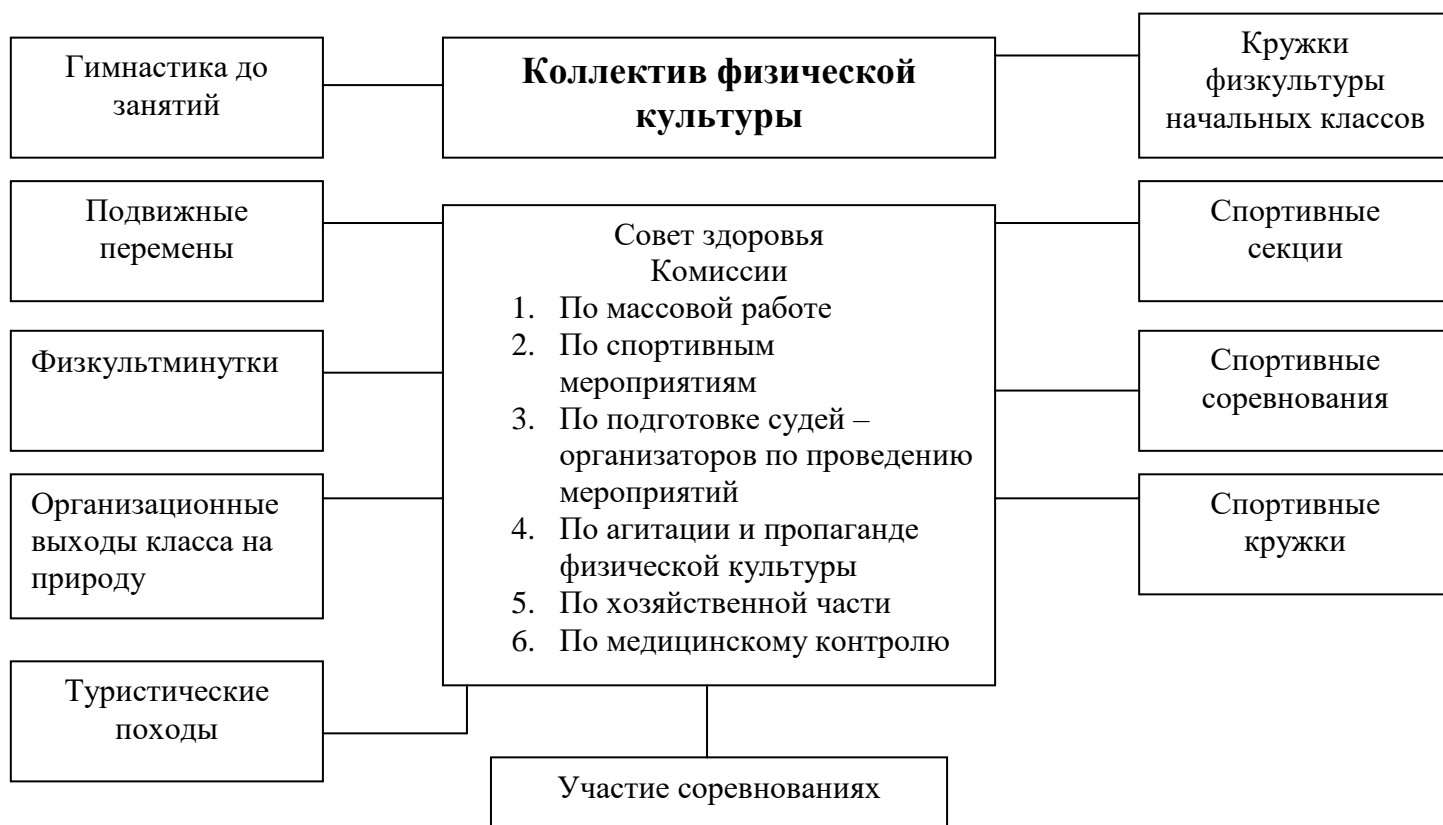
Схема физкультурно – оздоровительных и спортивных форм внеклассной работы в школе

Последовательностью организации следующего этапа является непосредственное планирование спортивно – массовых мероприятий по классам в школе. В первую очередь системно спланированы школьные спортивные соревнования, которые стимулируют ребят к занятиям физической культурой и спортом. Перечень проводимых мероприятий: весёлые старты; семейные старты; дни здоровья; снайпер; зимние забавы; мини – футбол; а ну – ка мальчишки; лёгкоатлетический кросс; эстафеты; баскетбол; волейбол; есть, встать в строй; конкурс песни и стороя; туристское многоборье; спортивное ориентирование; турслёт, участие в туристском учебно – тренировочном лагере, турпоходы.